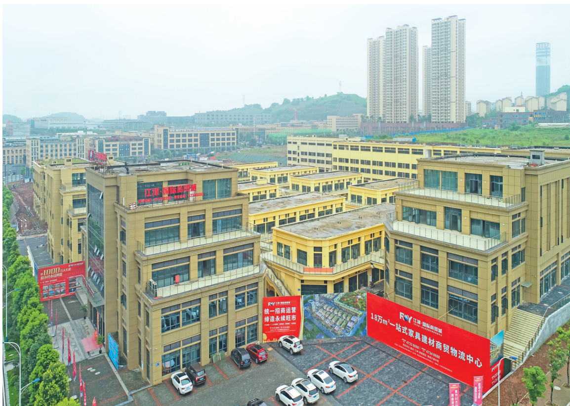
江津国际商贸城项目

本报讯(记者 廖洋 贺奎 通讯员 蒋雨航)昨日,记者在德感工业园看到,由香港五洲国际投资的江津国际商贸城项目建设如火如荼,部分项目进入装修扫尾阶段。据悉,该项目力争在今年年底全部投用。