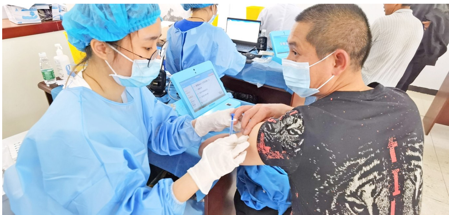
群众在家门口接种新冠疫苗

本报讯(记者 廖秋平 通讯员 衡巧)“请出示健康码,有序排队。”5月12日,为进一步方便辖区居民及企业职工就近接种疫苗,白沙工业园