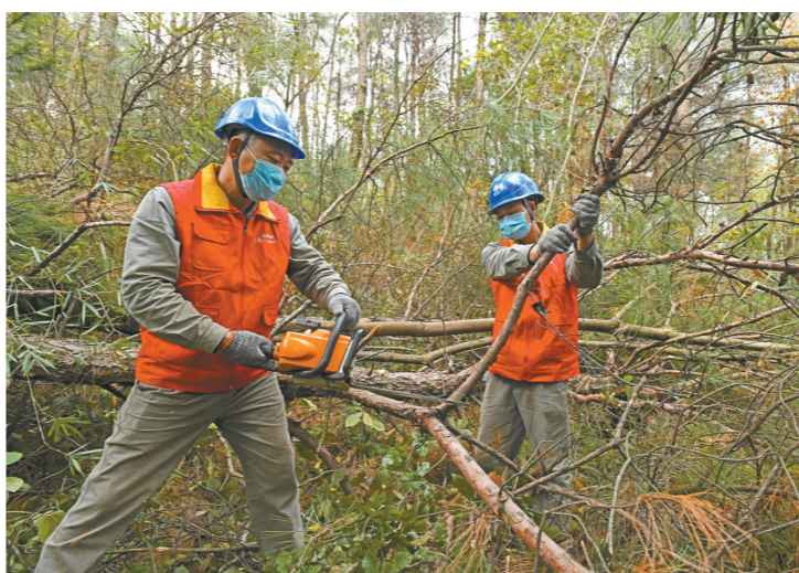
清理树障

下一步，江津区供电公司将继续加大政企沟通对接，加强宣传引导，形成群防群治的工作格局，合力推进树障清理工作，从源头治理“树线矛盾”带来的安全隐患，有效提高线路安全运行水平，确保电网安全稳定可靠供电。