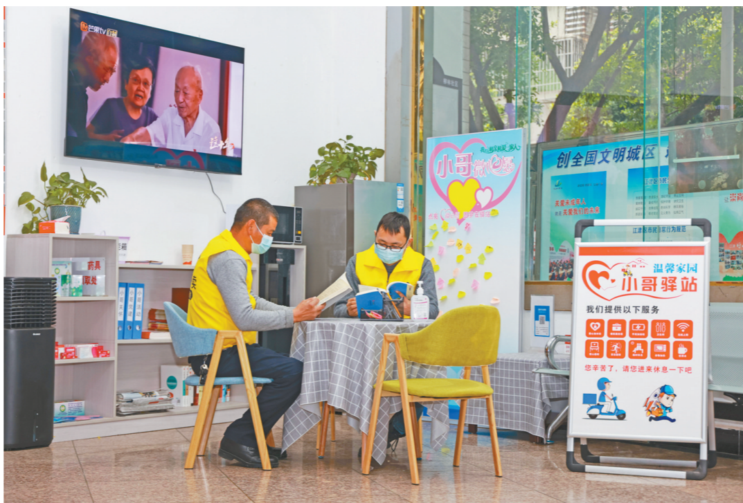
外卖小哥在“小哥驿站”看书

近年来，通过“小哥心愿墙”共收集意见建议127条，落实解决121条。其中，小哥进小区难、停车难、充电难等问题在街道党