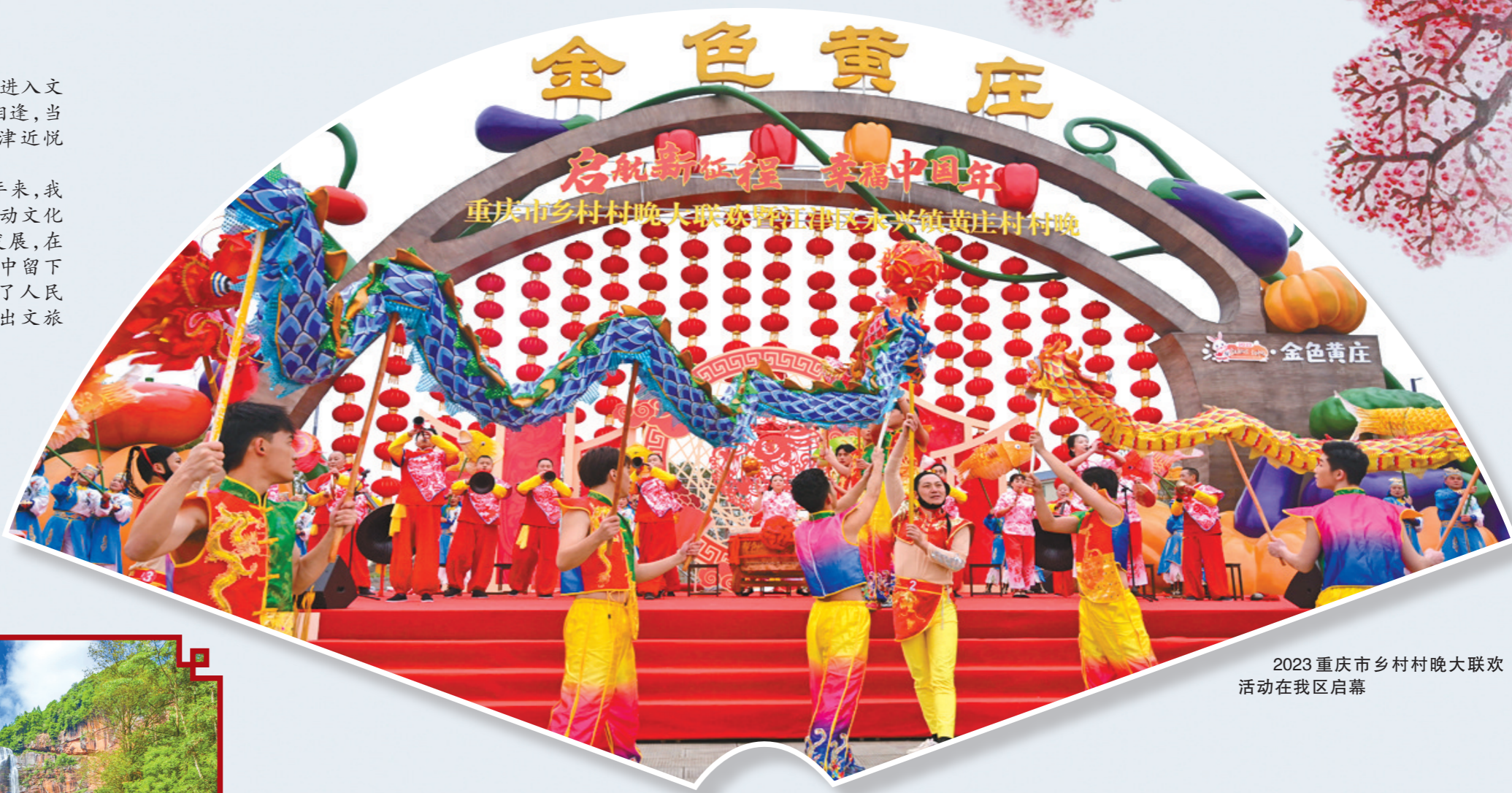
2023重庆市乡村村晚大联欢活动在我区启幕

扎根这一方文化沃土。近年来，我区坚持以文塑旅、以旅彰文，推动文化事业、文化产业和旅游业繁荣发展，在建设休闲旅游胜地的生动实践中留下一串串铿锵足音，更好地满足了人民群众对“诗和远方”的向往，融出文旅新图景。