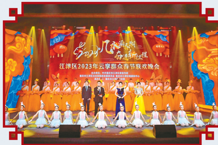
云享群众春节联欢晚会