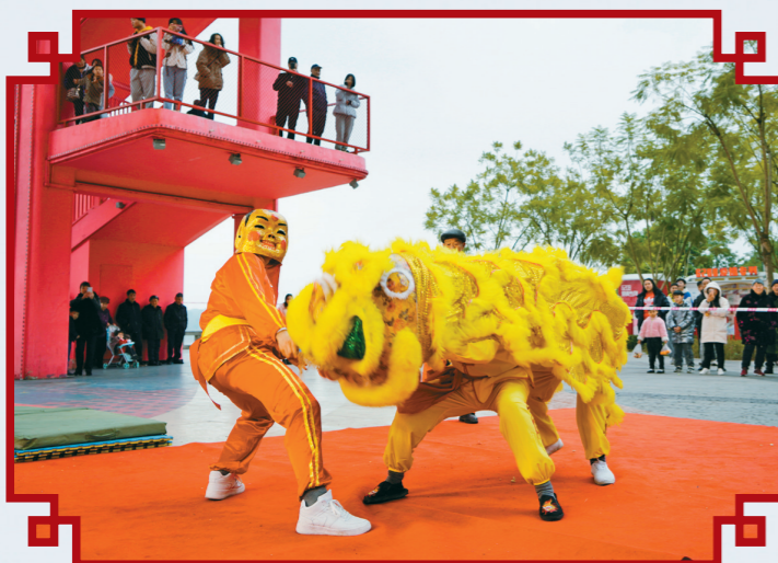
石蟆百戏技艺、白沙杂耍——“和尚”戏狮子