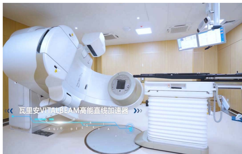
肿瘤治疗利器瓦里安直线加速器

去年全年，区二院开展区级以上科研立项14项，结题14项，发表论文26篇，发明适用性专利3项；共开展脑卒中介入取栓术、颅内动脉支架植入术、颅内动脉瘤隔绝术、腹主动脉瘤覆膜支架隔绝术、脾动脉瘤覆膜支架隔绝术、房间隔缺损封堵术、B超联合X线经皮穿刺治疗复杂性肾结石、双镜联合胃穿孔修补术、膝关节单髁置换术、单孔腹腔镜治疗妇科肿瘤切除术等新技术新项目160余项，让群众在家门口就能得到更好的救治。