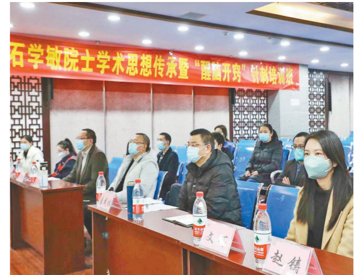
传承中医培训班开班