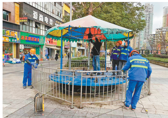
拆除现场

本报讯(记者 廖秋平 实习记者 焦玉顺 通讯员 韩效芝)近日,为进一步夯实全国文明城市创建工作,切实提升城市精细化管理水平,几江街道城管执法大队以“作风建设、市政执法提升城市形象”为主题,开展了占道经营整治工作,从小处着眼,从细节着手,切实履行好城市管理“管家”职责。