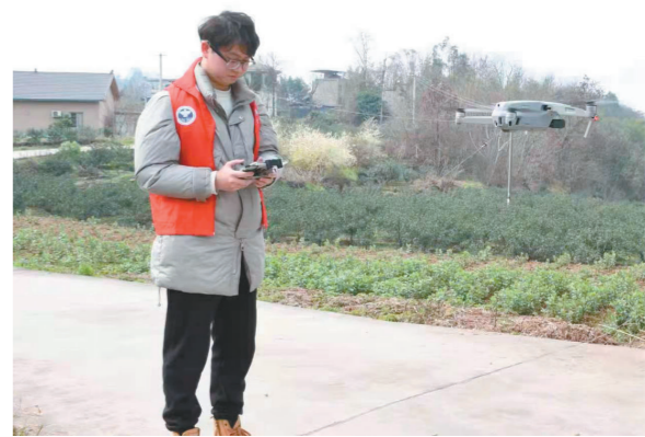
工作人员操作无人机勘察隐蔽区域

本报讯(记者 廖洋 通讯员 杨颜) 2月24日, 几江街道在石墙村和五举村采用“实地踏查+无人机”模式, 开展地毯式禁种铲毒踏查和禁毒宣传活动。