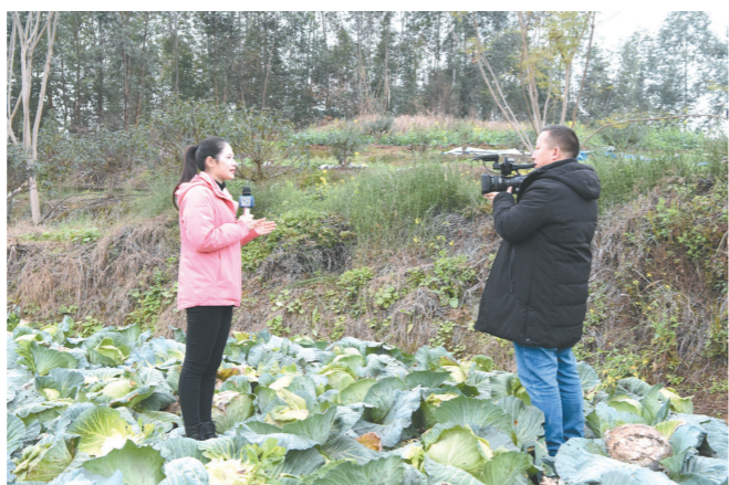
“问政帮帮帮”记者到现场报道