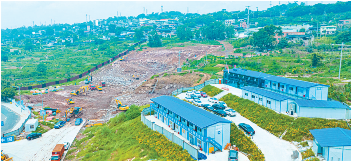
江沪北线高速公路滨江新城互通及连接线项目（燕子岩隧道）施工现场