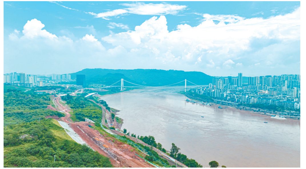
德滨路东段一期开展土石方施工

下一步，滨江新城将牢牢牵住重点项目建设这个“牛鼻子”，瞄准第三季度施工黄金期，强化多环节并联互动，保障高效率、高质量、高标准服务，全力抓好项目序时进度，做到谋划一批、储备一批、建设一批，聚焦项目攻坚突破，通过结果导向、抓纲带目、闭环落实等推动项目建设提质增效，奋力在打造江津“城市会客厅”、现代化高品质宜居城市中扛起新城担当，展现新城作为。