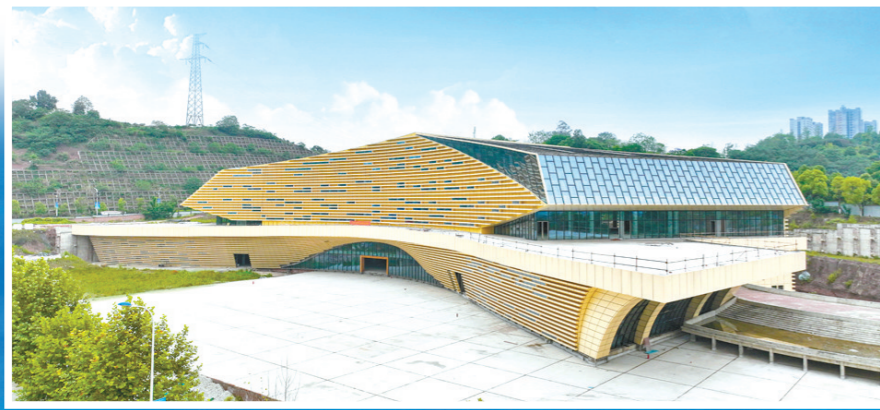
新城荟项目主体完工