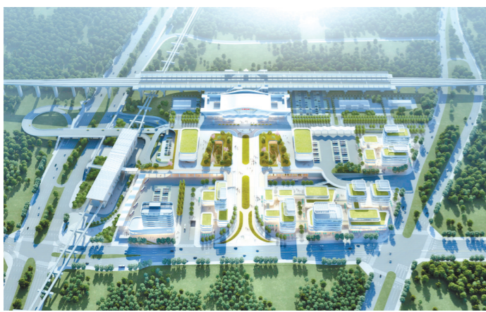
渝昆高铁江津北站综合交通枢纽项目已挂网招标