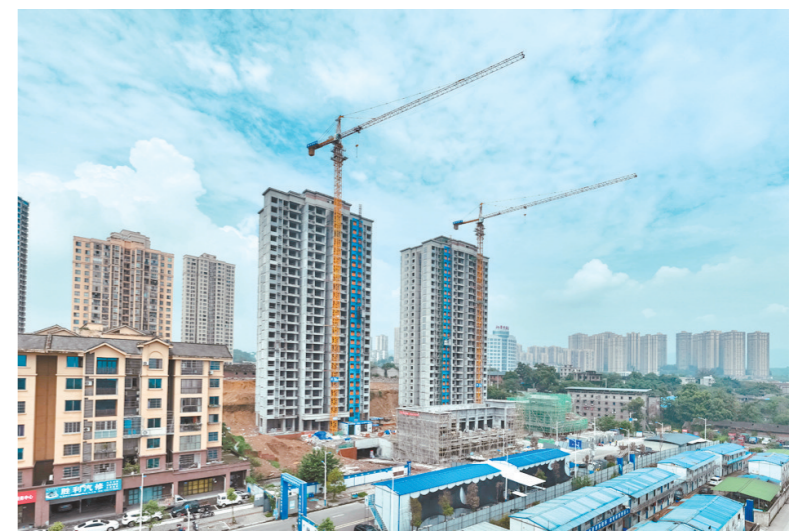
滨德佳苑项目主体已完工