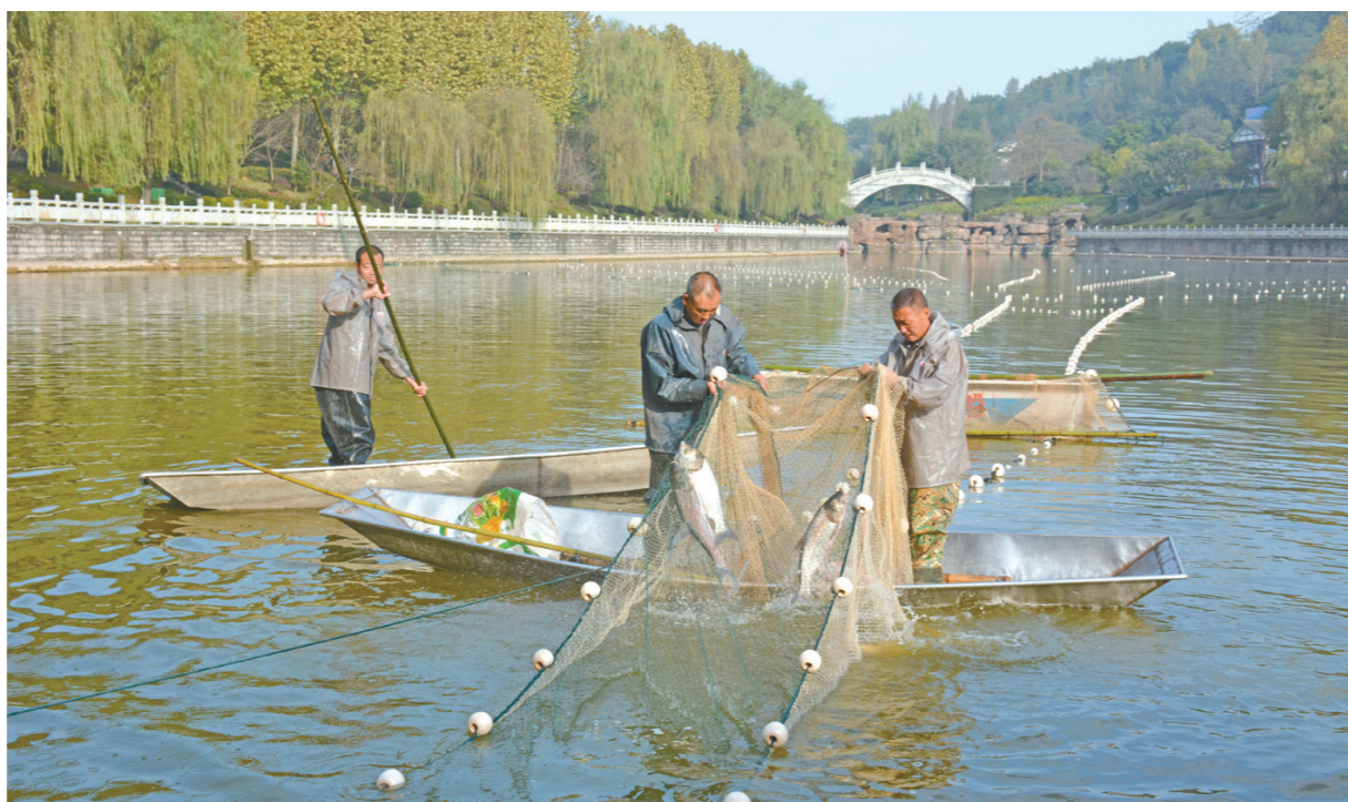
工作人员打捞清水鱼

本报讯(记者 胡耀方 通讯员 吴宣言)11月17日一大早,鼎山公园内异常热闹,在花漾湖和鼎山湖里,数名专业的工作人员正热火朝天地开展捕鱼活动。经过历时三天的布网、赶鱼、收网、捉鱼,最后打捞起总体重量达870斤的清水鱼,这批鱼随后被全部运往四面山水库集体放生。