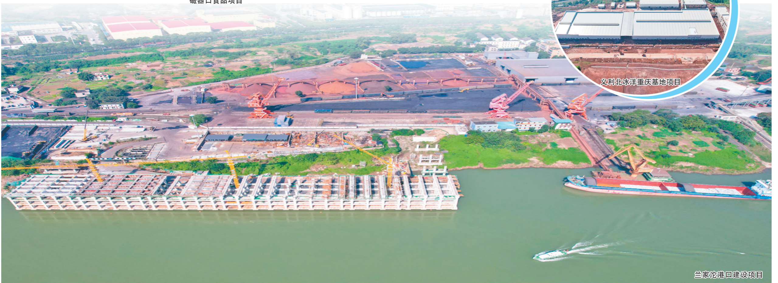
兰家沱港口建设项目