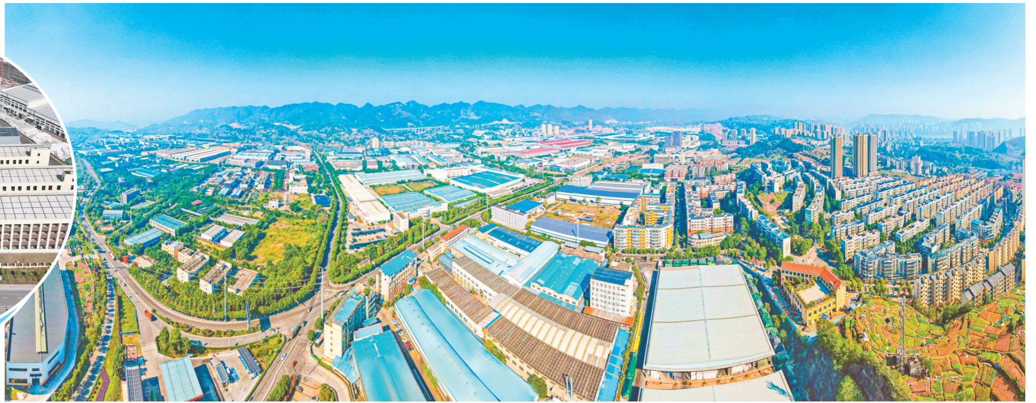
江津工业园区德感工业园