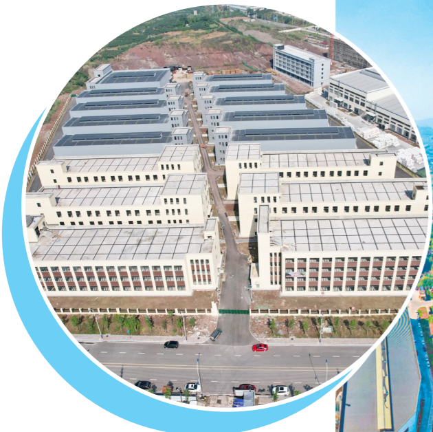
中诚信国家级建筑 劳务产业园基地项目