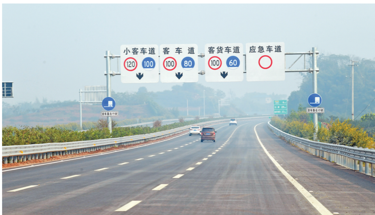
建成通车的江沪北线高速(重庆段)