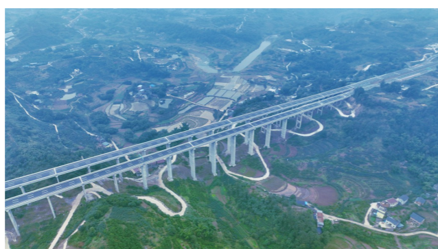
江沪北线高速新厂沟特大桥