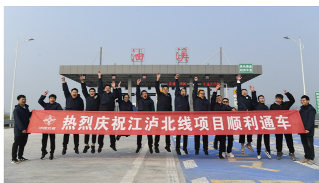
建设者欢庆通车

本报讯(记者 苏盛宇 陈婷)11月20日，江津至泸州北线高速公路(重庆段)(以下简称“江沪北线高速”)建成通车，并于当天17时正式向社会车辆开放通行。