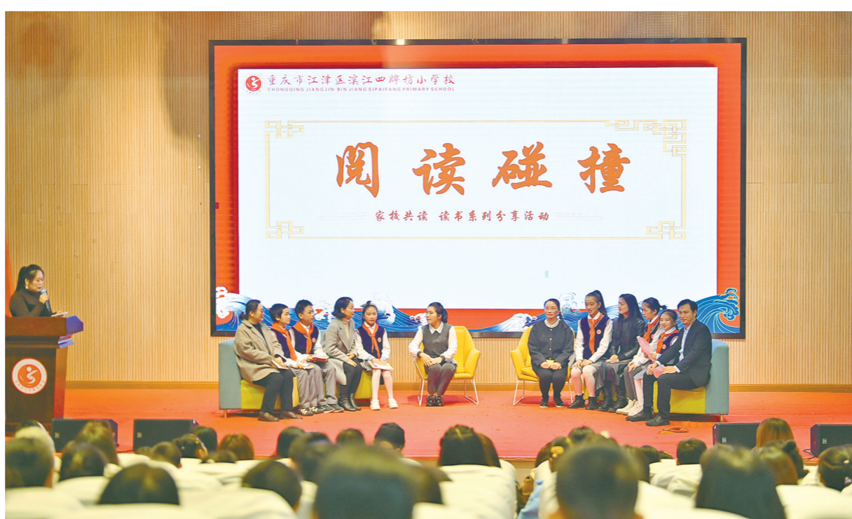
分享读书感受和收获

本报讯(记者 贺奎)11月24日,滨江四牌坊小学校举行第二期读书分享会。该校部分师生、家长齐聚一堂,一起畅谈读书的收获,共同抒发阅读感悟。本次分享会以“共沐书香 阅见未来”为主题,分为家长阅读分享、暖场游戏、阅读小剧场、阅读碰撞、美文朗读等环节,现场家长和同学们积极参与、踊跃作答,并以家庭为单位上台演绎名著经典桥段、分享读书感受和收获、诵读经典名篇,并对在第三学月中的阅读优秀家庭和班级进行颁奖。此外,学校公共区域还设置了书中经典人物展,同学们以班级为单位“摆摊设点”,扮演经典名著中的人物形象进行展示,并准备一些与此人物、此名著有关的问题进行现场有奖竞答。近年来,滨江四牌坊小学校严格落实区委、区政府以及区教委部署安排,以“爱读书、读好书、善读书”为口号,组织开展了主题鲜明、内容丰富、形式多样的家校共读活动,让师生家长爱读书,知晓读书的重要意义,通过晨诵、午读、暮省,每2个月开展一次系列读书分享会,评出“书香家庭”“书香班级”,让阅读成为新优质学校一道亮丽的风景,助力我区推进全民阅读活动在学校走深走实。