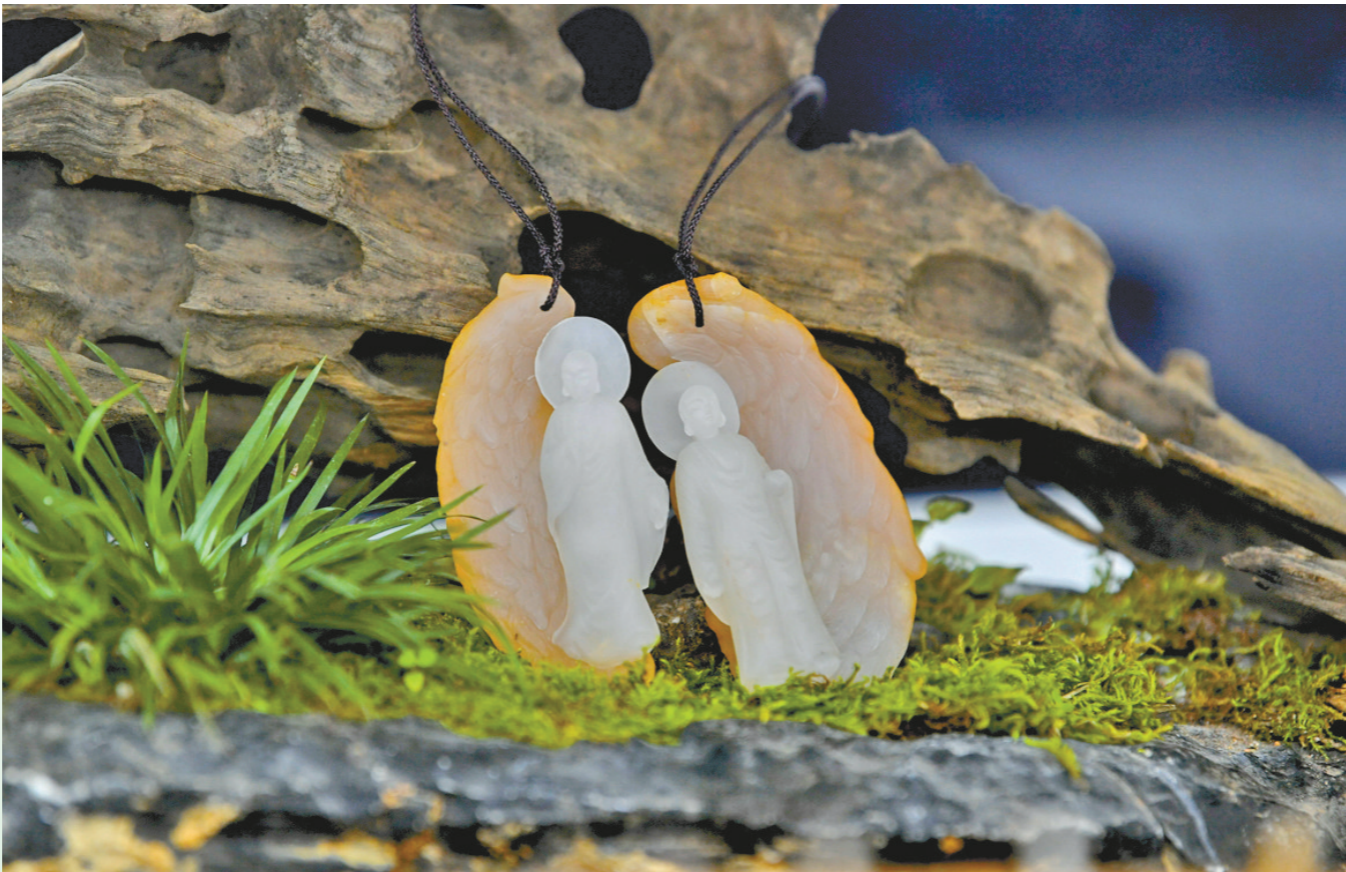
作品《佚名》 作者：魏峰泽 作品材质：江津玉