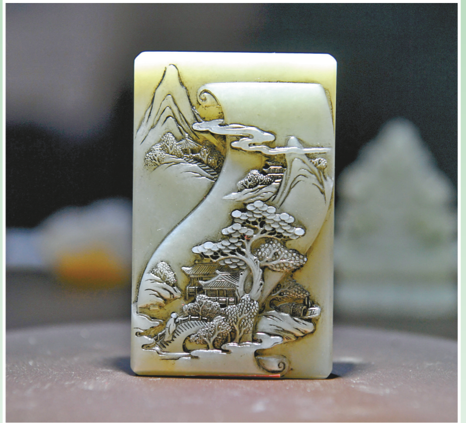
作品《禅心雨后山》（职工组金奖） 作者：卞宇杰 作品材质：和田玉