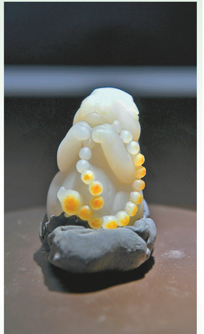
作品《福兔佑安》（学生组一等奖） 作者：尹炳生 作品材质：江津玉