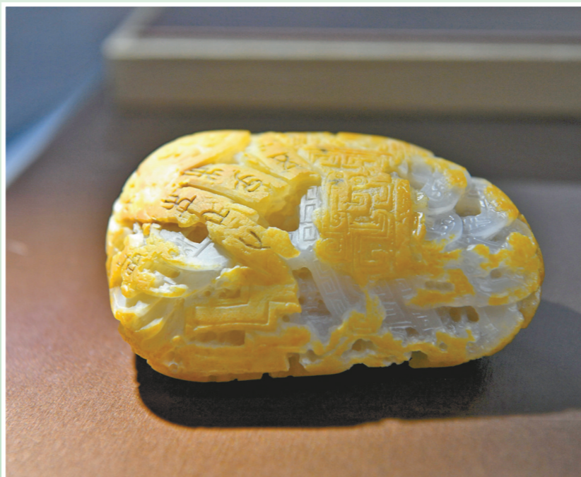
作品《古蜀遗珍》 作者：杨光强 作品材质：江津玉