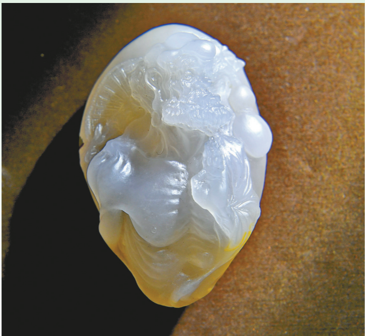
作品《达摩祖师》（学生组一等奖） 作者：刁思汉 作品材质：江津玉