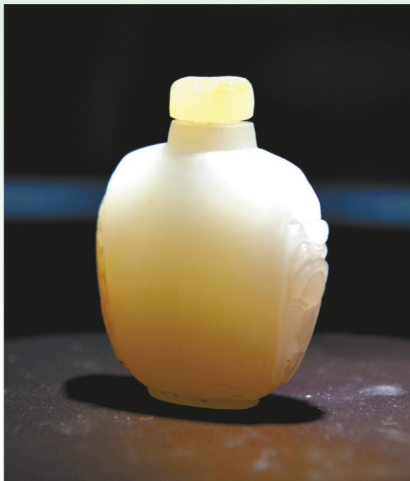
作品《云起龙骧》（学生组一等奖） 作者：赵文婧 作品材质：江津玉