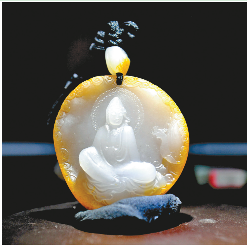
作品《丹凤观音》（职工组金奖） 作者：王国清 作品材质：江津玉