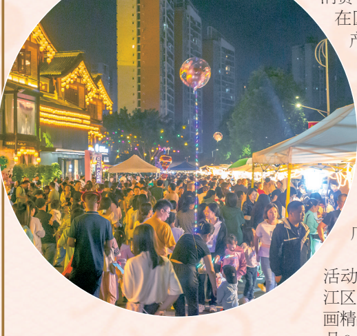
千年荣昌·梦回盛唐在夏布小镇举办

此外，还推出了许多群众“家门口”的活动，让群众“家门口”的活动，让群众“家门口”的活动，让群众“家门口”的活动。