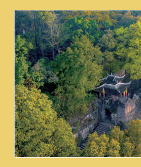
钓鱼城景区云舍茶馆

除举办各种文艺演出外，合川钓鱼城、漆滩古镇、龙多山等景区也备好春节“旅游盛宴”。