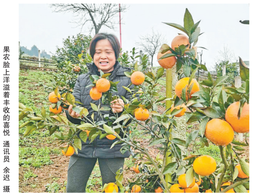
果农脸上洋溢着丰收的喜悦

为了方便游客采摘和购买,华盖村沃柑园负责人表示:“欢迎大家到沃柑园体验采摘的乐趣,如果想要带回家与亲朋好友分享,每斤沃柑售价2元。果园也为大家提供代客采摘服务,10斤起送。”沃柑的采摘期将持续至4月下旬。如需了解更多信息可提前预约,联系电话:13996407873,19923600661。