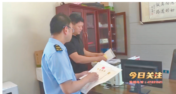
江津区慈云镇市场监督管理所工作人员检查公司营业执照