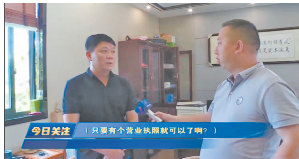
公司企业法人接受记者采访