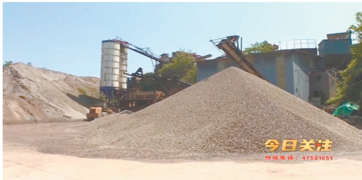
重庆朗臻建材有限公司生产经营场地

为什么这家公司的注册地址和实际生产经营的地址不一样？这样是否符合相关要求？几经周折，记者终于找到了重庆朗臻建材有限公司实际生产经营场所。据该公司企