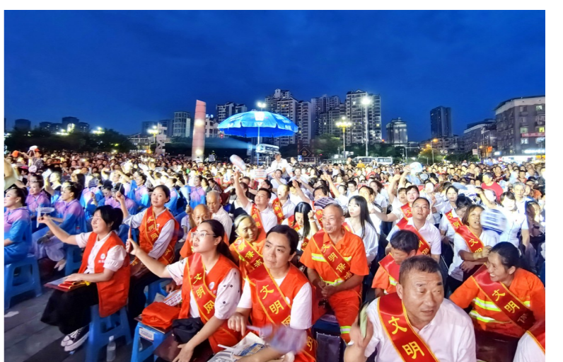
双福街道决赛现场气氛热烈