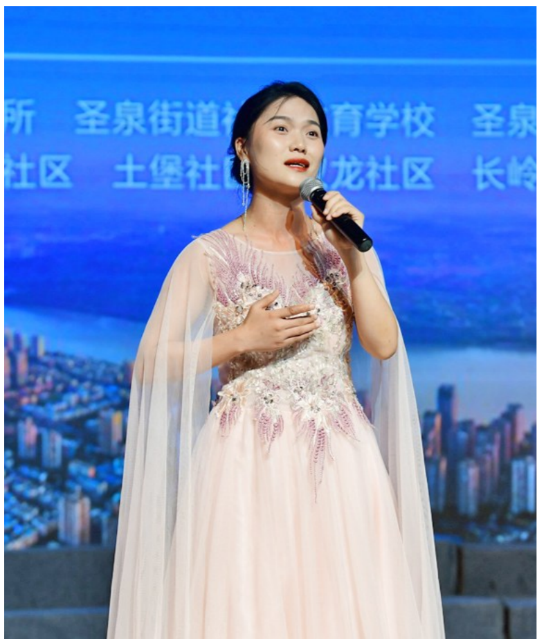
圣泉街道片区决赛独唱《越人歌》动人心弦

今天，让我们再次走进“滨江之夏”社区海选、街道比赛活动现场，领略社区群众的风采和群众文化活动的魅力。文/徐莹