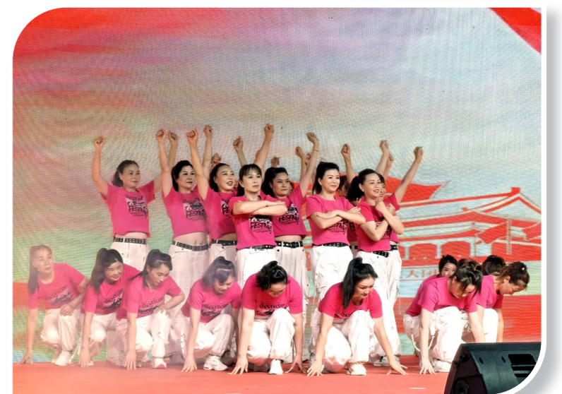
双福街道决赛现场群众活力四射