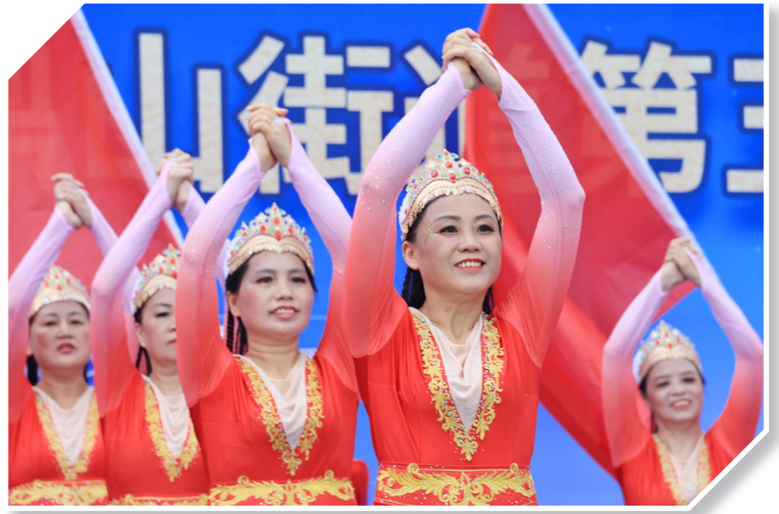
鼎山街道片区广场舞(歌咏)比赛暨鼎山街道第五届邻里节中群众表演舞蹈