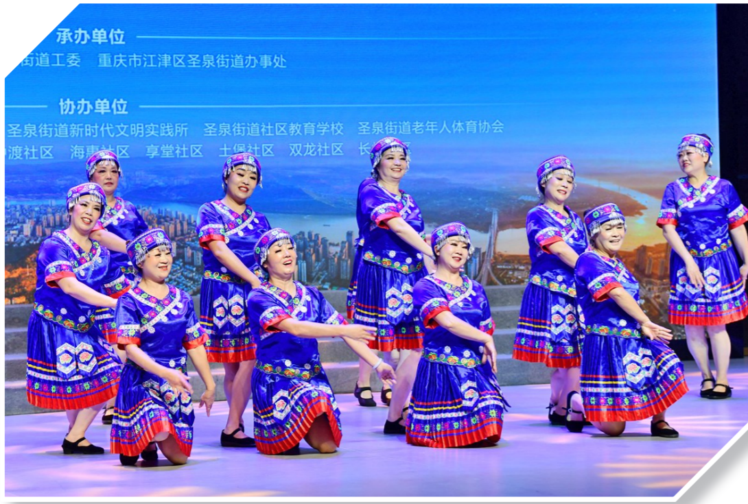
圣泉街道片区决赛舞蹈《云里土家》别具风情