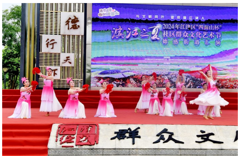
德感街道汇演活动群众表演群舞《亲吻祖国》