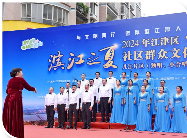
几江片区(独唱、小合唱)决赛现场歌声悠扬