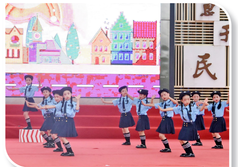
德感街道汇演活动儿童表演情景舞蹈《交通安全出行》