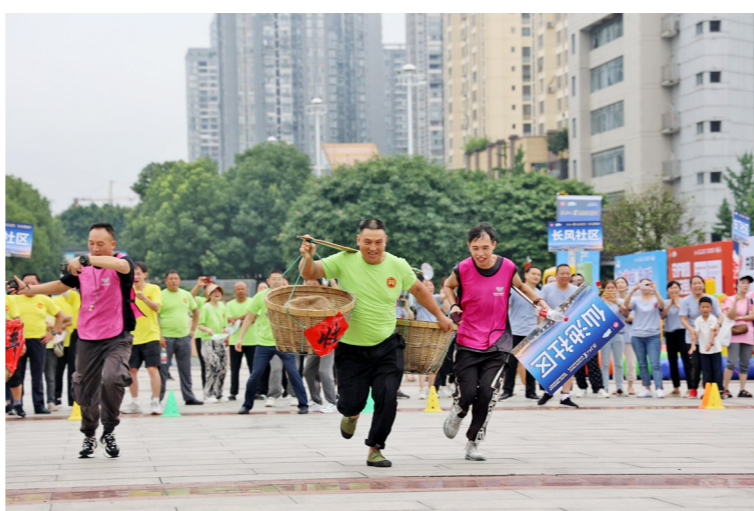
鼎山街道片区活动中邻里互动游戏趣味横生