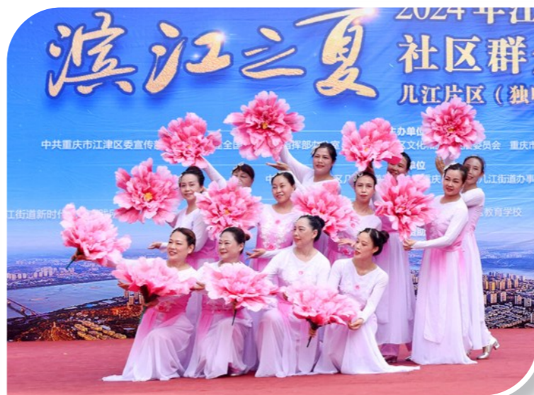
几江片区广场舞决赛群众翩然起舞