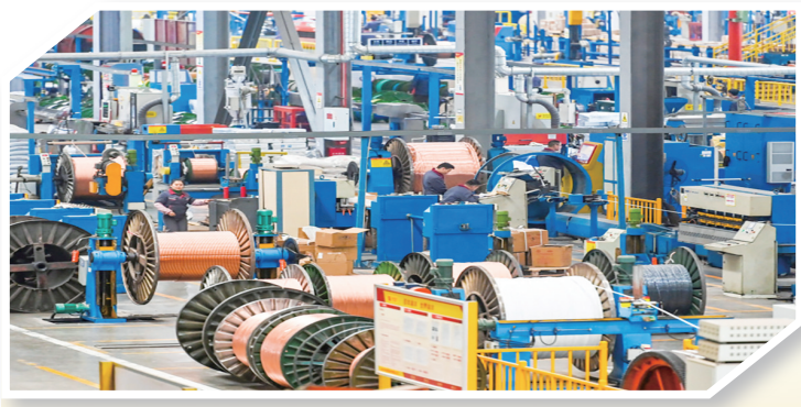
渝丰线缆生产车间