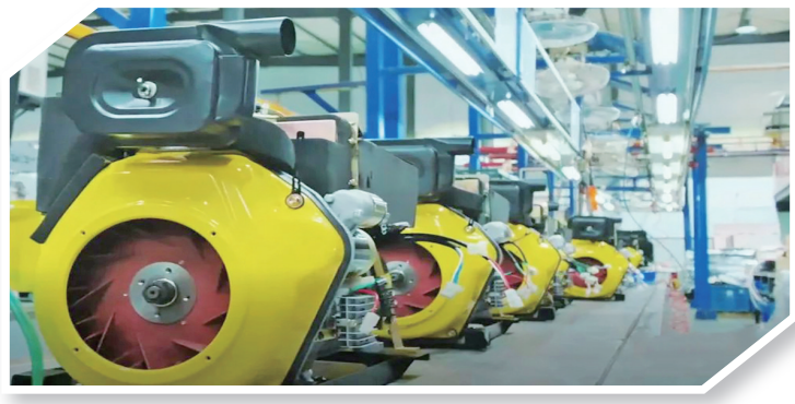
威马农机产品远销海外