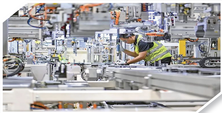
耐世特数字化生产车间