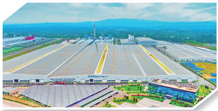
武骏光能年产8GW光伏封装材料及制品项目