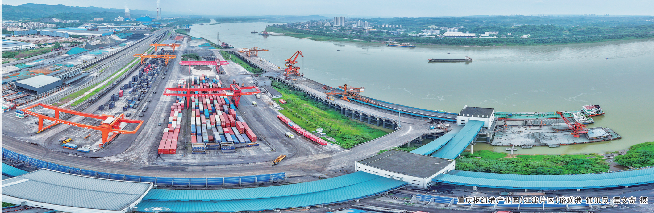
重庆枢纽港产业园(江津片区)珞璜港