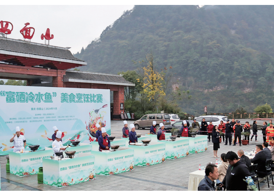
烹饪高手齐聚一堂切磋厨艺

此外，大赛期间还设置了展区，集中展示江津地区的特色产品及地方名小吃。这些展品不仅为大赛增添了丰富