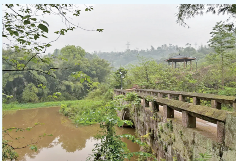
成渝古道江津段古桥