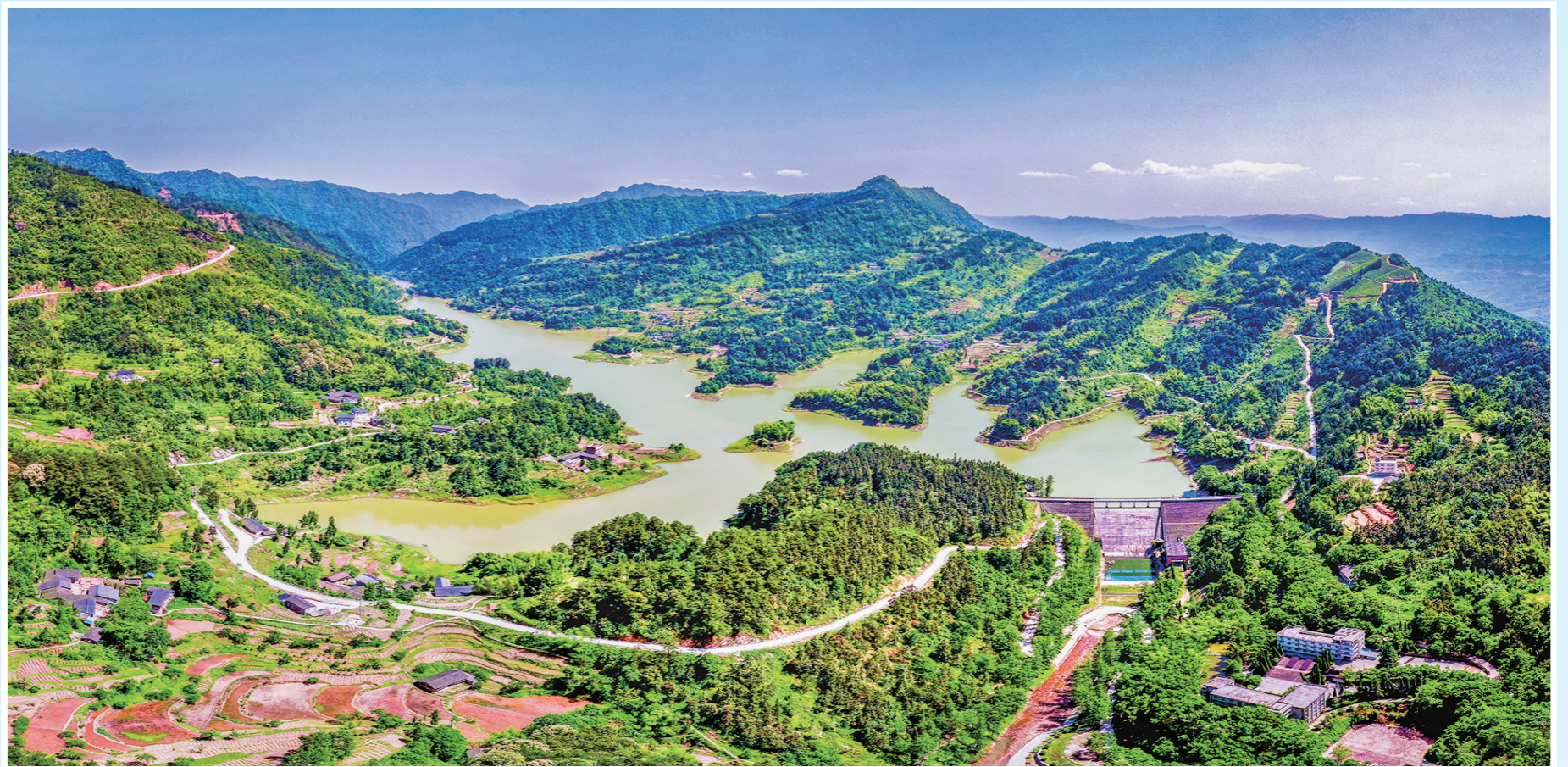
清溪沟国家水利风景区

聚巴山渝水之灵秀，汇天地造化之神奇，江津有无数值得我们去探寻的地方。今年10月底，江津区在“扛起新使命 区县谈落实”系列主题新闻发布会上发布了《探索新境·江津篇》，推出了4条新境旅游线路，分别是四面山1314爱情环线自驾行、秘境古道徒步行、文博考古研学行、最潮老酒赏味行，对自驾、徒步、文博、非遗四类主题产品进行了个性化打造，并向广大游客发出热情邀请，欢迎大家到江津探索新境。