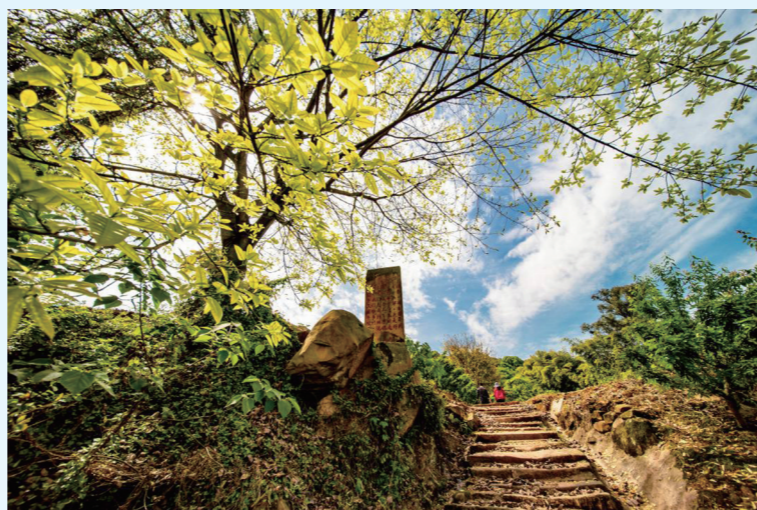
成渝古道江津段古韵依旧

温馨提示： 徒步活动是一项既健康又充满乐趣的户外运动，但为了确保每位参与者的安全与舒适，请提前规划，选择线路、了解路况难度及所需时间；关注天气情况，避免恶劣天气出行；携带并学会使用徒步地图和指南针，以防迷路；穿着舒适、透气、适合徒步的运动鞋和衣物，注意保暖；携带必要的水、食物、急救包、手电筒/头灯、雨衣等；徒步过程中不留下垃圾，不破坏自然环境；保护野生动植物；了解基本的急救知识，遇到受伤情况立即处理并寻求帮助。