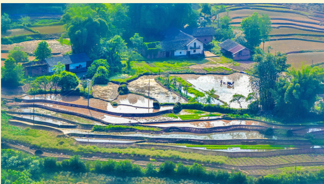
2024年4月29日，中山镇春耕图景美如画。

家乡，是我灵魂的原乡，是我生命之根深扎入的土地。这里的每一寸风、每一粒沙、每一道炊烟都编织着我童年的梦，滋养着我的心灵。家乡的山水田园、街巷屋舍，都承载着我满满的回忆与深情，是我永远的眷恋与牵挂。