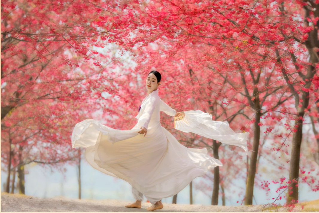
2024年2月20日，游客在蔡家镇猫山樱花节拍照留恋。