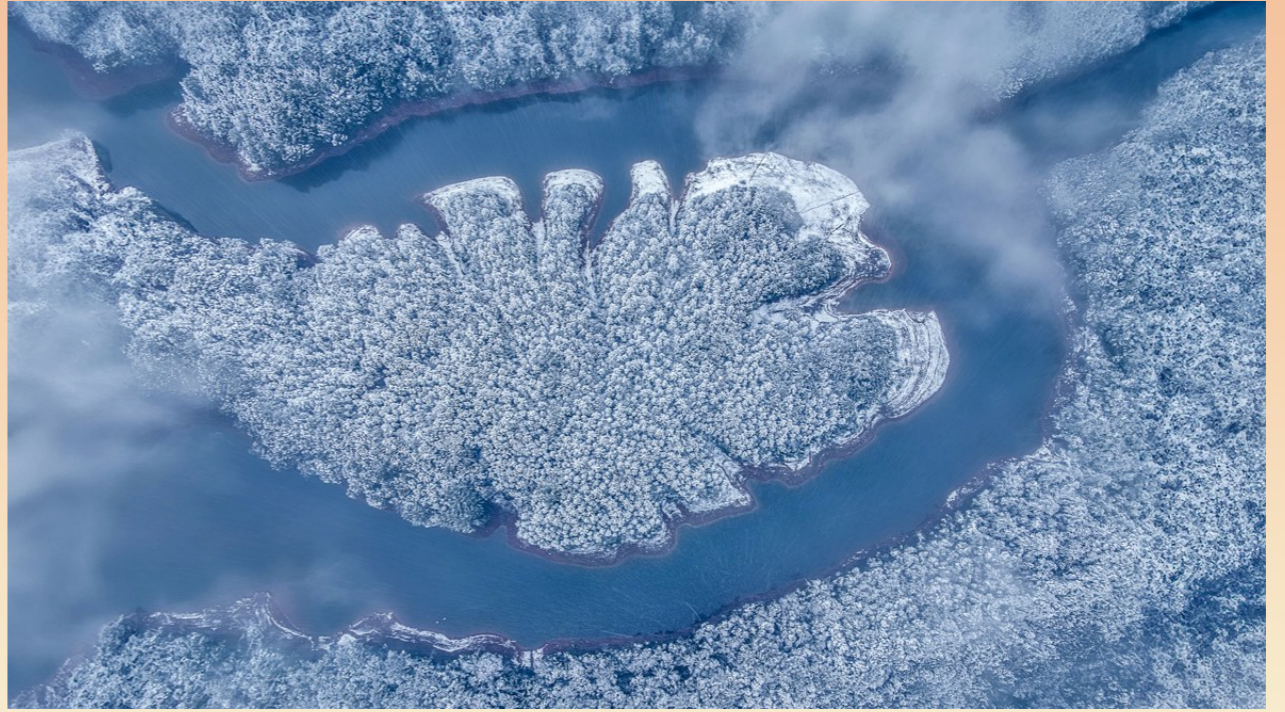
2024年2月24日，四面山林都湖迎来初雪。