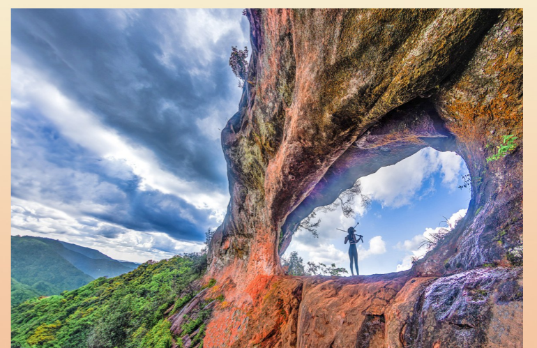
2024年4月27日，游客“打卡”四屏镇青堰村“天眼”。