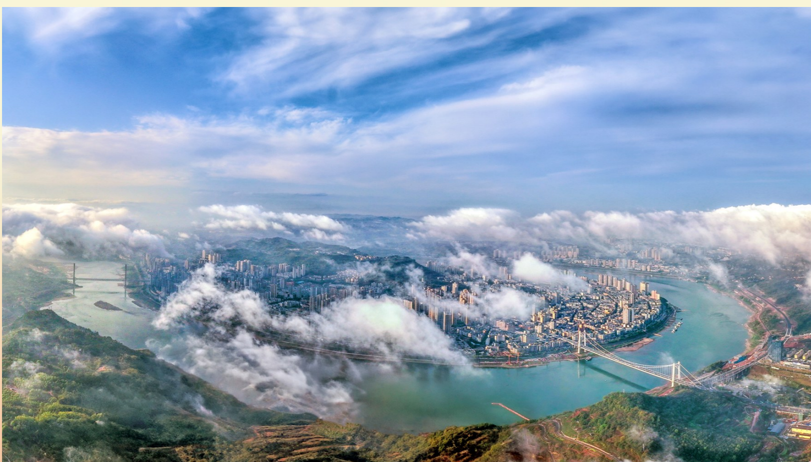
2024年3月27日，晨雾笼罩下的江津城。