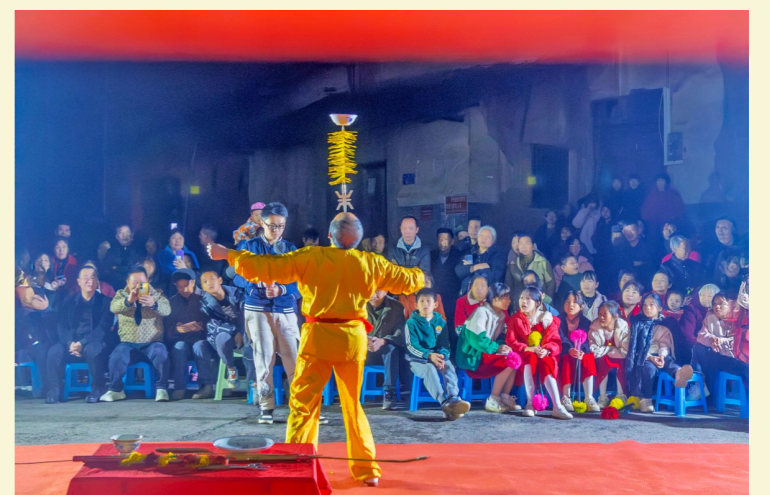
2024年11月23日，区新专联文化艺术团下乡为白沙镇松林社区表演传统杂耍。