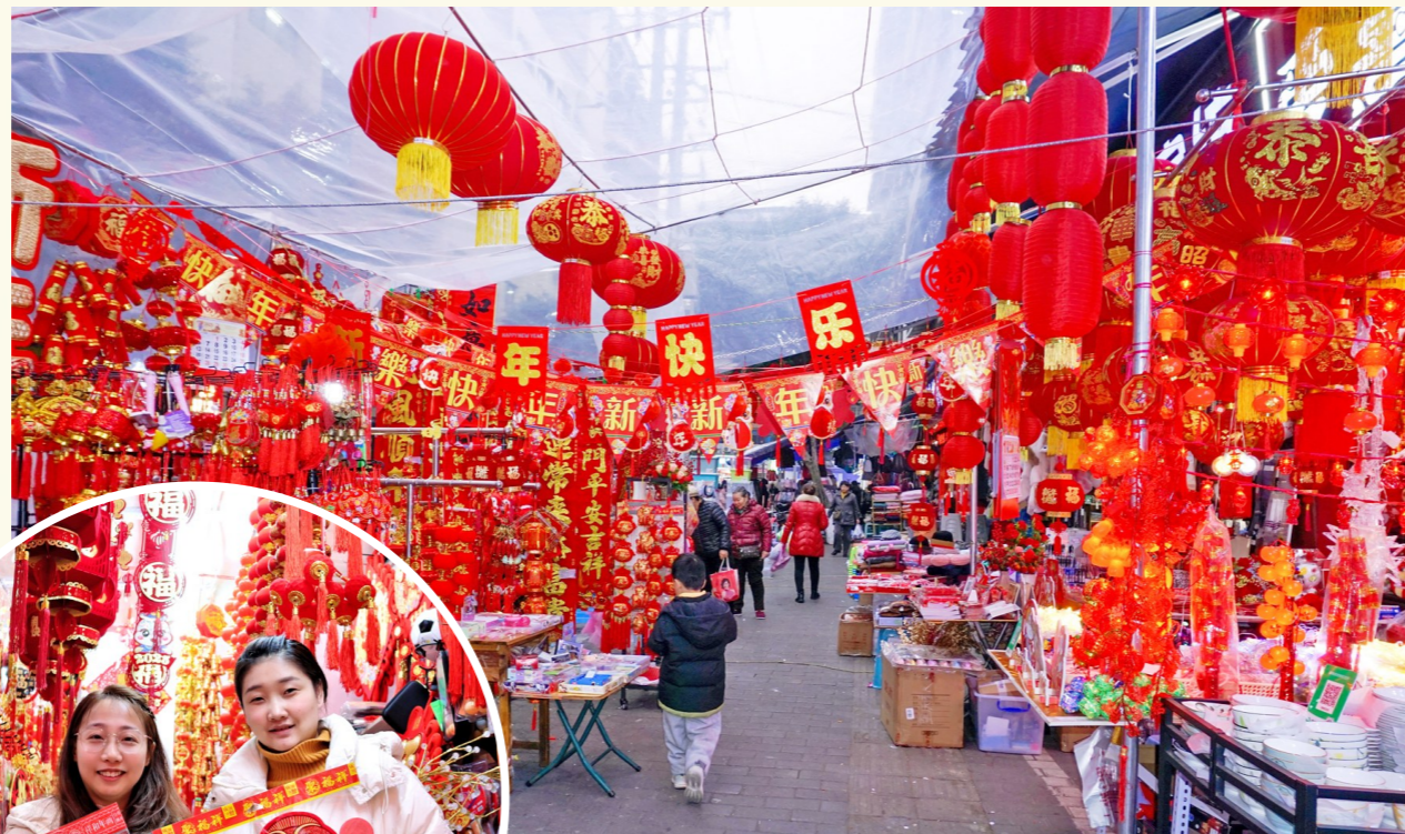
“蛇主题”新春饰品走俏

金蛇纳福,吐故纳新。这是许多人对传统文化中“蛇主题”的正面认知,那还有更多认知吗?记者随机采访了不少市民,大家纷纷分享了自己的观点:“妈妈说蛇会蜕皮,就像我们长大换新衣服,希望我能快快长大!”“蛇有灵气,愿新岁无病无灾,身体健康。”“蛇能屈能伸,希望新的一年事业灵活变通,升职加薪。”“蛇的形态优雅,期盼自己也能身姿曼妙,灵动如蛇。”