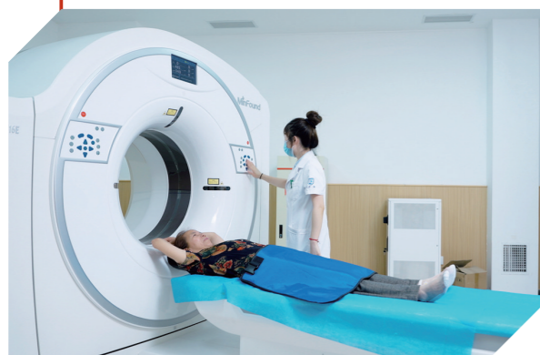
医养照护中心为长者提供全面医疗服务