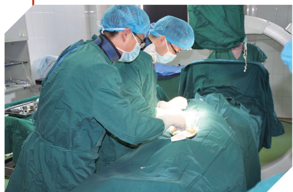
射频消融术治疗心律失常手术