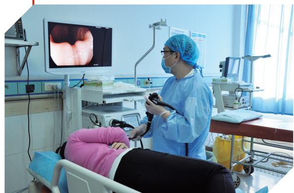
潘太克斯电子胃肠镜