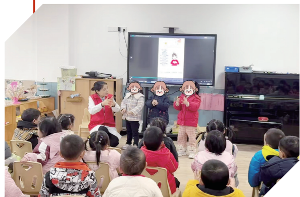
“健康小喇叭”志愿服务走进幼儿园