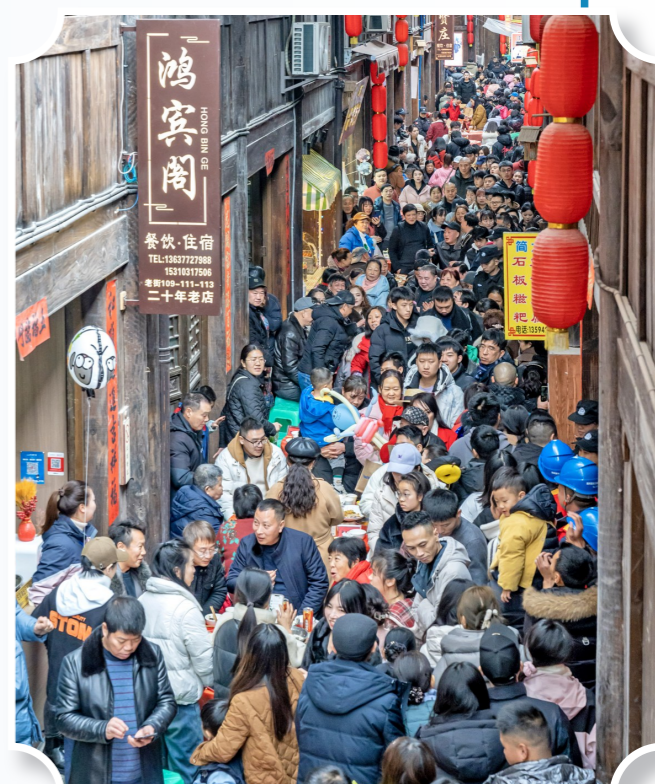
第十九届中山古镇千米长宴吸引八方游客