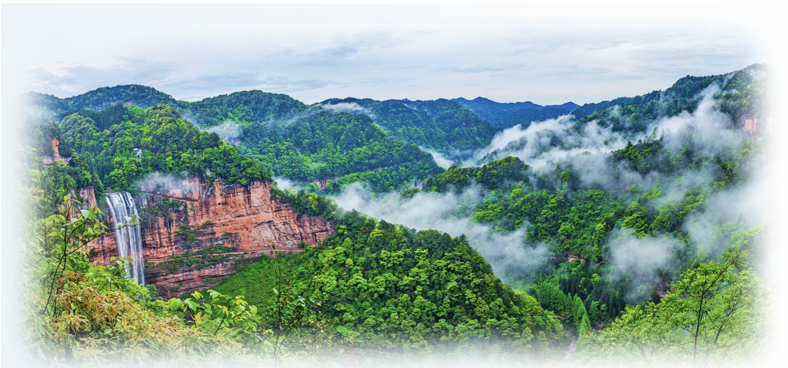
四面山望乡台瀑布