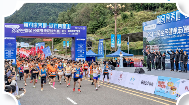
“相约康养地 爱在四面山”2024中国城市健身走(跑)大赛城市联动接力赛反响热烈