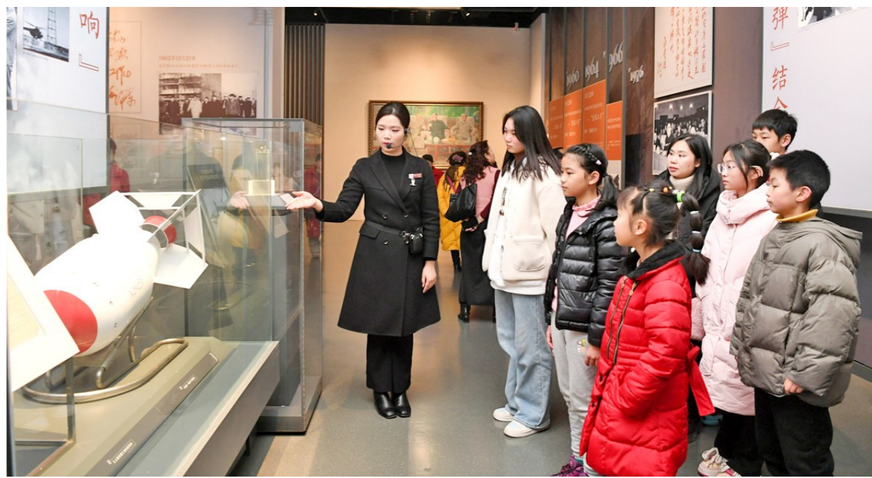
游客在讲解员的带领下有序参观

引进专题展览《我在江津——从出发到出发·黎光波·情绪记录馆》《巴渝记忆·革命人物清廉故事图片展》。展览内容囊括入文历史、科学科普、艺术审美、自然风光等,一场文化盛宴呈现于游客面前,成为欢度新春的又一好去处。