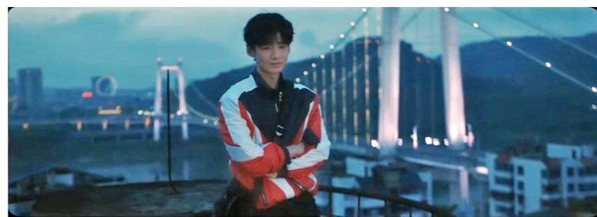
四牌坊小学拍摄场景（资料图）