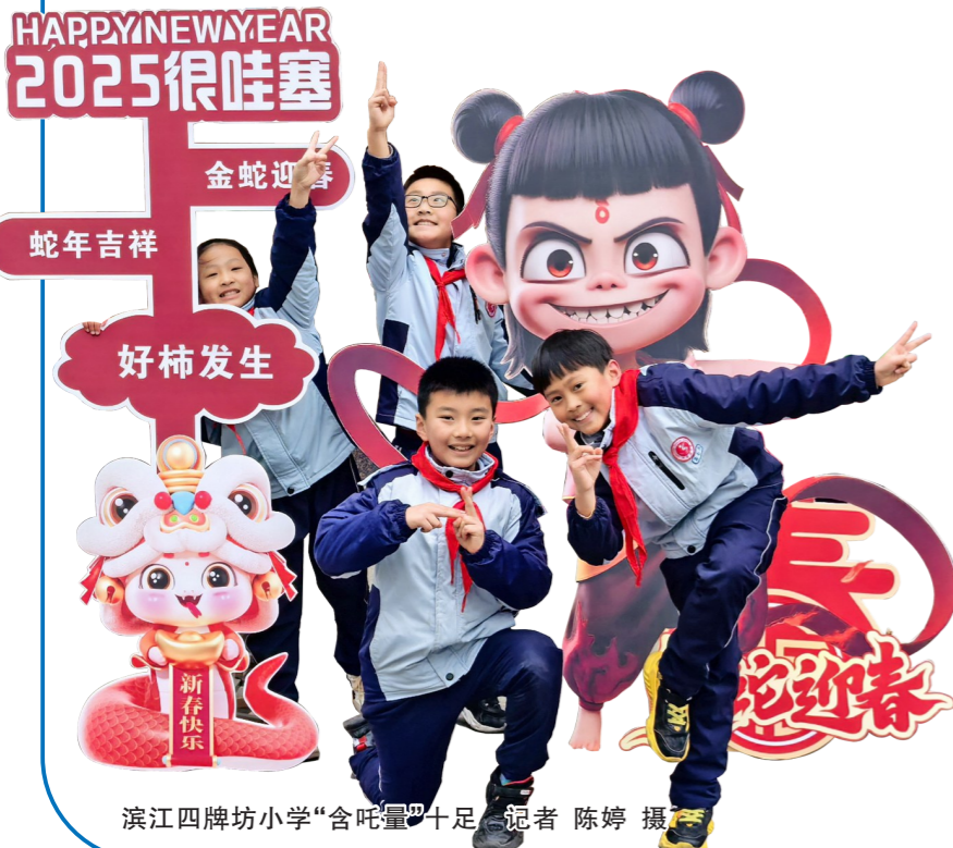
滨江四牌坊小学“含蛇量”十足。