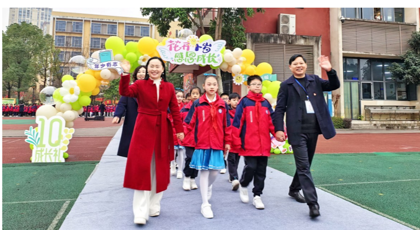
更是学校坚持多年的德育品牌活动,深受师生和家长好评。

据了解,东城小学的“花开十岁”德育活动已坚持多年。该活动不仅是学生们开启新学期的重要仪式,