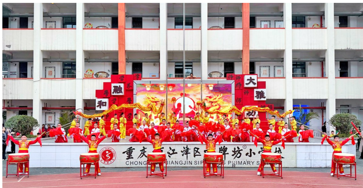
▲ 四牌坊小学师生欢聚一堂

据了解,2024-2025学年上学期,四牌坊小学以高质量党建引领学校高质量发展,高素质教师队伍立德树人成效显著,高素质学生团队硕果累累。在“重庆市2024年语文学科优质数字资源遴选”比赛中,5人获一等奖,35人获二等奖;多名教师撰写的延时服务案例获重庆市二等奖;在江津区首届劳动优秀作品比赛中,一名教师撰写的案例获一等奖,5名学生获一等奖,12名学生获二、三等奖。接下来,该校将进一步抢抓