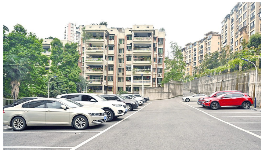
用闲置地改造成的便民停车场

“小区更新改造后，很多住户都把自己家重新装修了一遍，也有二三十户住户搬了回来，这无疑是对老旧小区改造项目最好的反馈。”几江街道桥南社区有关负责人说。