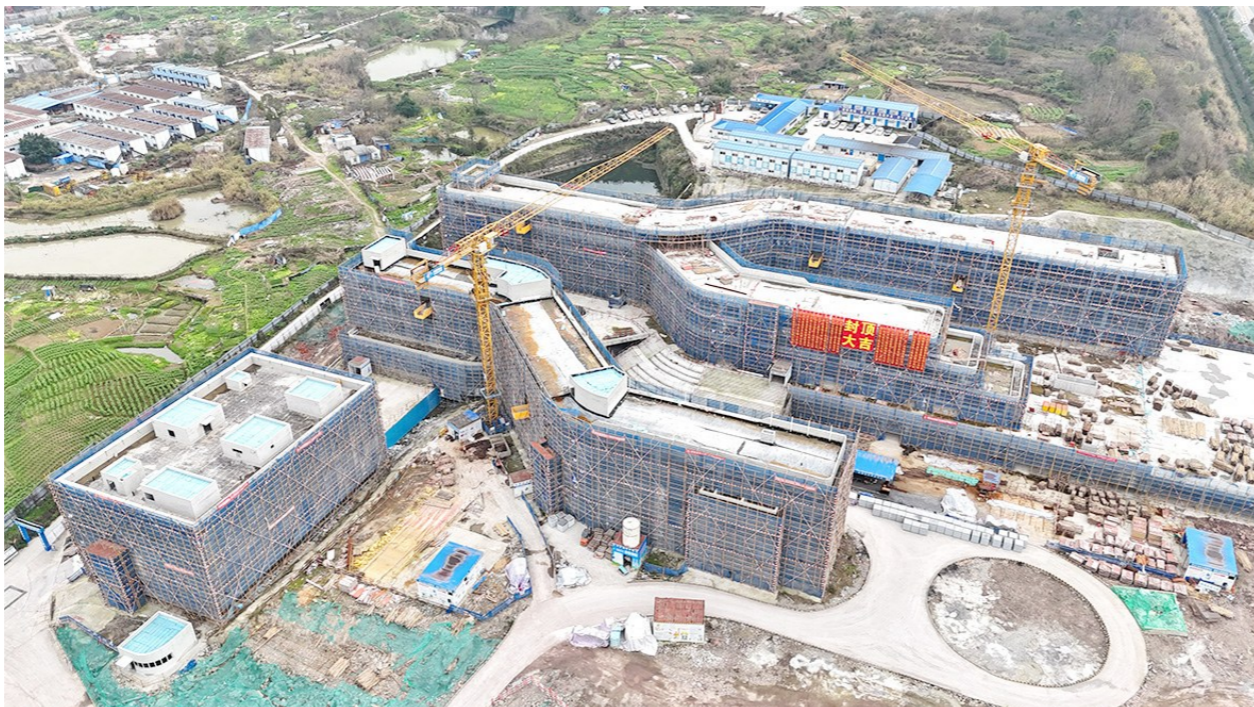
江津综保区第二小学项目建设现场

紧张的问题，更成为孩子们成长的乐园。”园区相关负责人表示，学校建设完成后，将为学生提供优质的学习和生活环境，同时进一步扩大区域优质资源供给，缓解周边区域的入学压力，提升园区教育教学质量水平。