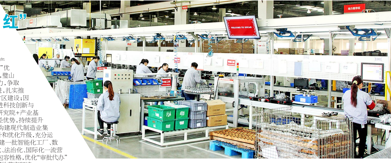
璧山区 重庆大江动力设备制造有限公司生产车间一派繁忙景象

注塑机、成型机、全自动风口装配机等生产设备高速运转,空调出风口、料杆储物盒总成、内开手箱总成等汽车内饰物功能产品陆续下线。生产线上,工人正忙着将产品打包装箱……2月23日,位于璧山区的重庆臻康风电科技有限公司生产车间内一派繁忙景象。“公司今年的产品订单量预计比去年增加约20%。”该公司董事长袁道祥说。