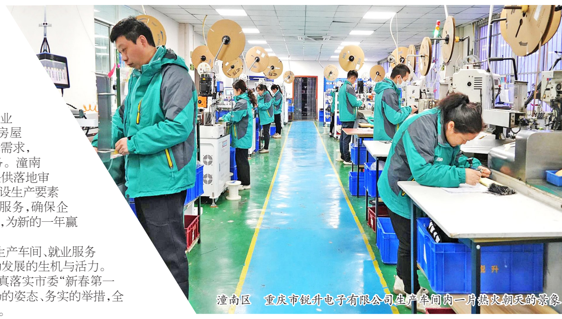
潼南区 重庆市锐升电子有限公司生产车间内一派热火朝天的景象

开局关乎全局,起步决定走势。今年以来,潼南全区上下以“开局就是决战,起步就是冲刺”的饱满干劲,全力以赴抓项目、抓投资、促增长,奋力夺取一季度“开门红”,为实现经济社会发展“全年胜”打下坚实基础。