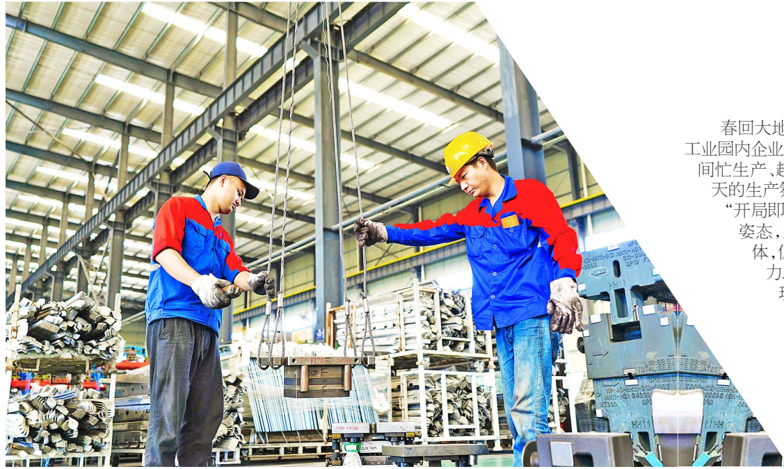
江津区 重庆耀晟科技有限责任公司生产车间