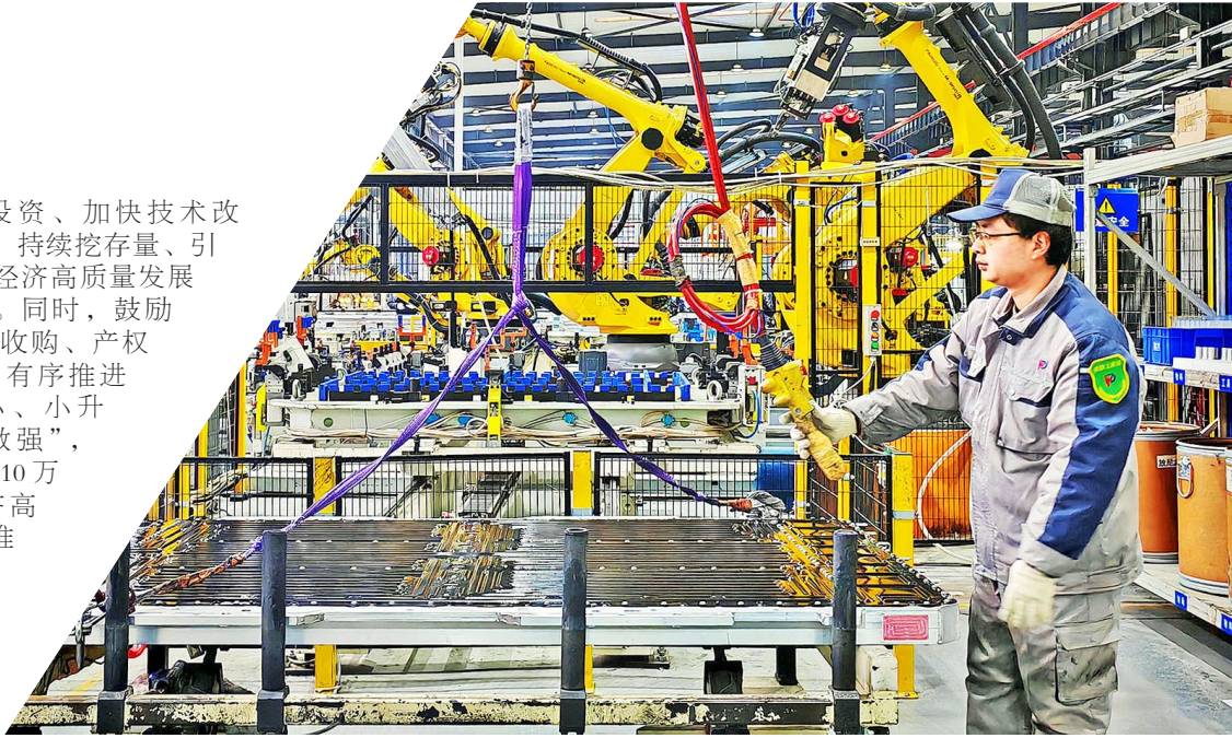
合川区 重庆平伟汽车系统有限公司的机械化、智能化生产车间

春风浩荡三江岸,奋进合川万象新。2月7日,合川区举行2025年第一次招商引资项目集中签约仪式,成功签约项目45个、协议总投资260亿元;2月19日,合川区举行一季度重点项目集中开工竣工投产活动,涵盖开工、竣工投产项目96个、总投资超200亿元……随着一个个重点项目签约投资、开工建设、竣工投产,为合川拼经济、抓落实、冲刺一季度“开门红”注入了旺盛强劲的动力,吹响了合川加快打造成渝中部地区先进制造业基地的“冲锋号”。