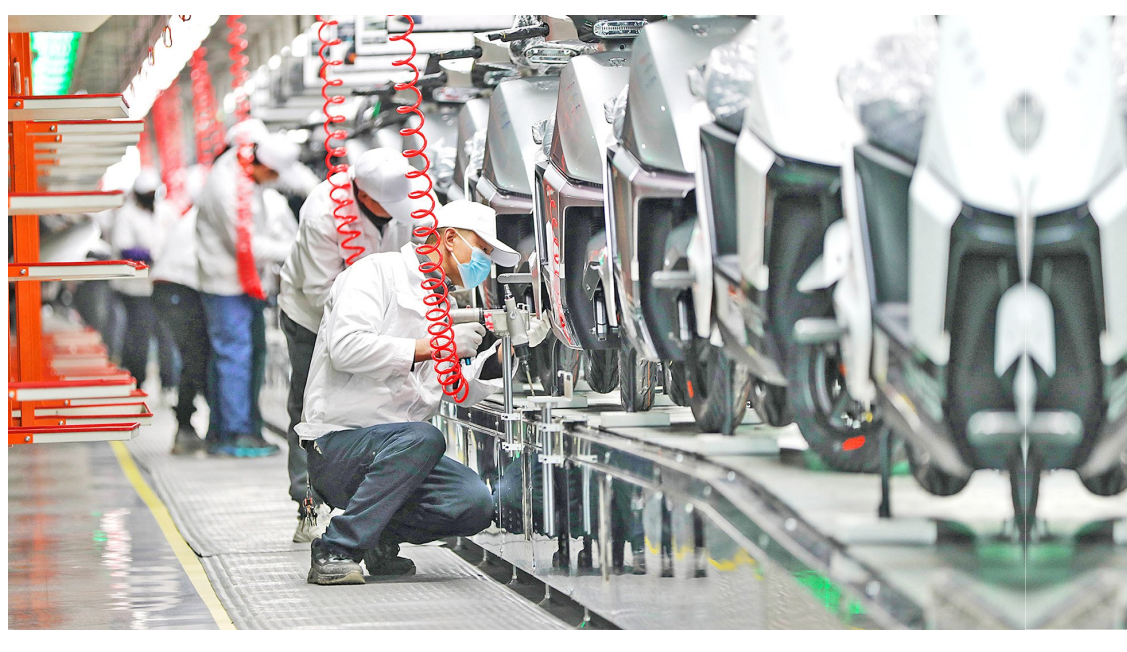
大足区 绿源集团控股有限公司重庆生产基地内,工人正在加紧生产

春回大地,万物竞发。眼下,江津各工业园内企业纷纷开启奔跑模式,抢抓时间忙生产、赶订单,处处洋溢着热火朝天的生产氛围。今年以来,江津区以“开局即决战,起步即冲刺”的奋进姿态,主动精准高效服务经营主体,促进惠企政策直达快享,全力助推企业稳产增产,确保实现一季度经济“开门红”。