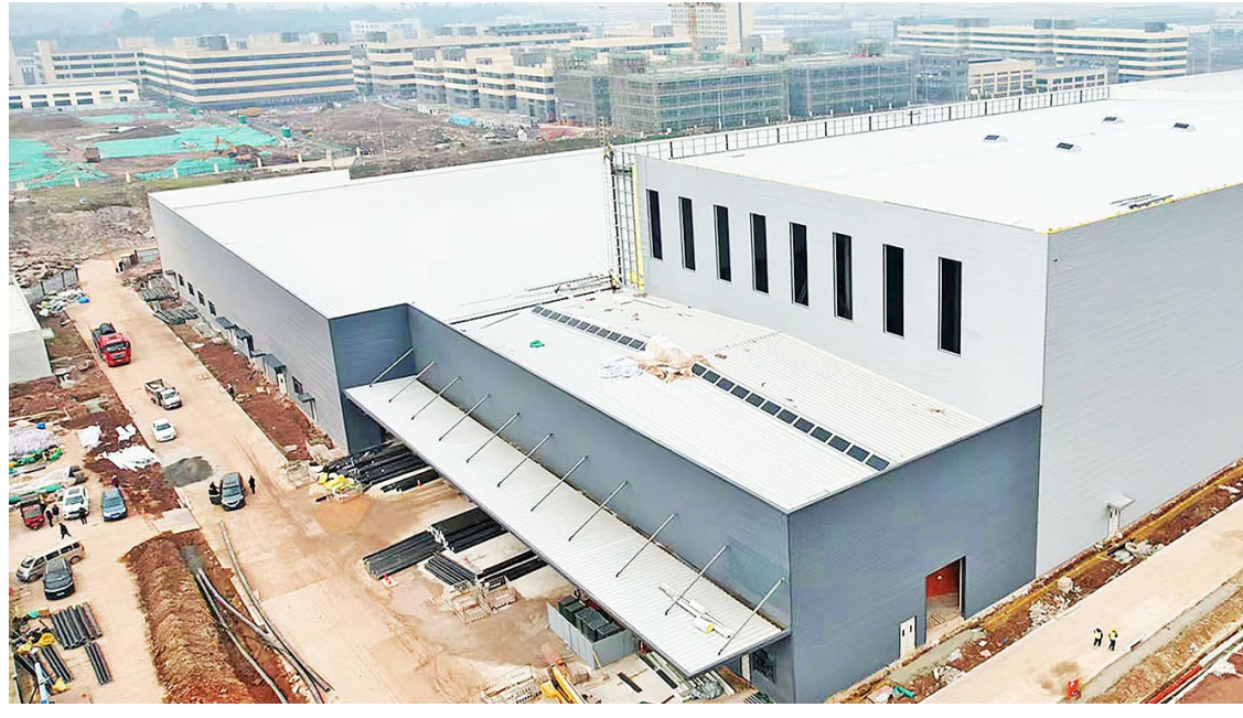
铜梁区 铜梁高新区厚生新能源锂电池隔膜西南基地一期主厂房建设完毕

人勤春来早,奋进正当时。蛇年伊始,大足各企业呈现全力以赴“开门红”的火热场景,各行各业、各领域忙生产、赶订单、拓销路,以“开局即冲刺”的姿态奏响春日“进行曲”,奋力冲刺新春“开门红”,为全年经济高质量发展开好头、起好步。