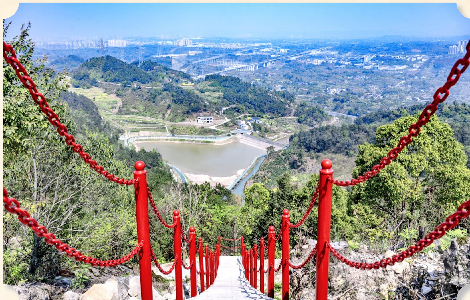
成渝古道与渝昆高铁、江沪北线高速形成“千年古道与世纪工程”的时空对话

古风徒步与现代潮玩的混搭，让全家老小皆能找到乐趣——父母追溯历史，孩子奔跑嬉戏，情侣静享阳光，全年龄段都能在此找到“诗与远方”。