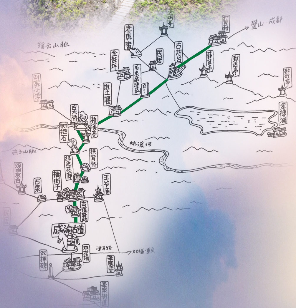
成渝古道江津段手绘示意图 姜春 作