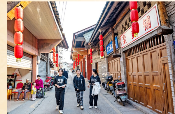
游客漫步双龙老街