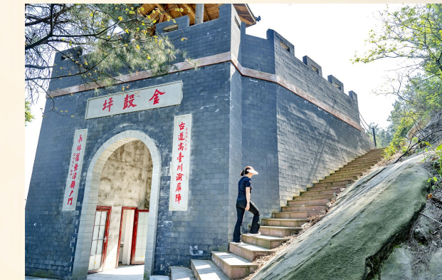
古炮台见证曾经金戈铁马

位于三河村，是总投资近2000万元重点打造的金樽湖休闲产业园项目，项目以金樽湖为核心的乡村旅游休闲带，在生态环境打造为重点的同时，同步建设众多旅游景观以及儿童游乐设施，最终实现生态美、产业兴、百姓富。目前金樽湖项目已建设完成，场地可开展铁人三项、钓鱼、登山等多种体育活动，同时成功引进重庆重二旅游管理有限公司入驻成立金樽湖·小派营地，营地设有滑梯、露营帐篷等。