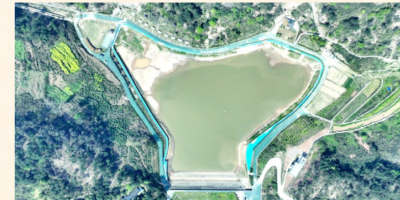
金樽湖户外设施齐全

古大桥就是这条成渝古道江津段其中一部分，现在的古大桥为光绪年间重建，位于圣泉街道三河村桥溪河。全部由青石板组成，全长约50米，单孔石拱桥。